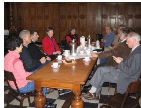
Ontvangst met koffie