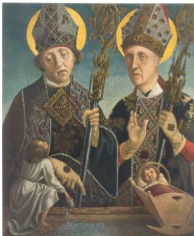
St Augustinus en Ambrosius St Wolfgang Michael Pacher

Ik ging ook van hem houden. Aanvankelijk niet omdat hij een leraar van de waarheid was, want daar rekende ik niet meer op in uw kerk, maar omdat hij mij zo welwillend tegemoet trad. Ik ging met grote belangstelling luisteren naar zijn preken. Niet met de bedoeling waarmee ik daar had moeten komen. Ik wilde een indruk krijgen van zijn welsprekendheid. Was die echt zo groot als men van hem vertelde? Zijn woorden boeiden me en sleepten mij mee, maar met hun inhoud wist ik niets te doen. Ik genoot van zijn spreken. Hij was beter geschoold dan Faustus, en tegelijk ook iets minder innemend en betoverend. Wat de inhoud betreft, was elke vergelijking tussen hen onmogelijk: de een dwaalde in bedriegerij, de ander gaf heilzaam onderricht in het heil. Maar dat heil staat ver af van zondaars, en van mensen zoals ik daar stond. En toch kwam ik van lieverlee dichterbij, zonder het me bewust te zijn.