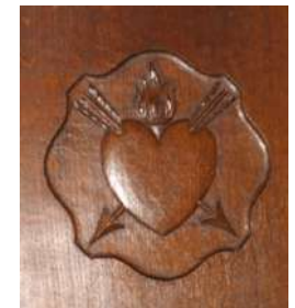
In veel details is zichtbaar dat we hier in een augustijnerklooster zijn!