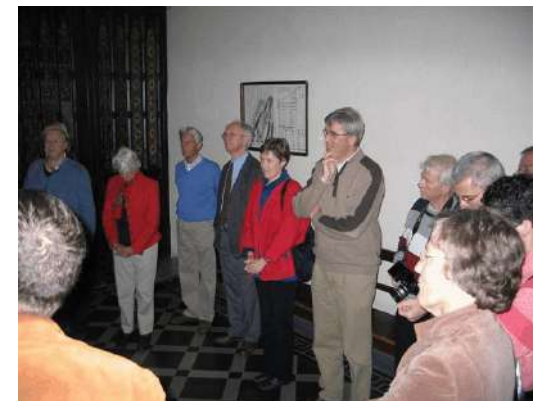
Uitleg over het klooster