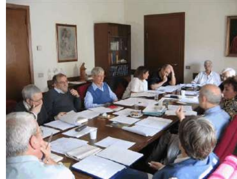
Rome, oktober 2005

De Orde heeft al vele jaren een Commissie voor de Leken . De leden worden telkens voor een periode van zes jaar benoemd door het Algemeen Bestuur van de Orde, in overleg met de verschillende Provincies. Voor het eerst is de Commissie nu uitgebreid met een aantal leken. In de eerste vergadering stelde de nieuwe Commissie: als we werken voor de Leken, doen we dat niet zonder de Leken. Van meet af aan kreeg de Commissie in 2001 de opdracht mee om een Congres van