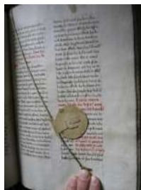
In de bibliotheek

De binnengekomen reacties worden op de Bestuursvergadering van 24 november besproken. In de verdere voortgang van invoering van de Statuten is met name 8 : 'Geldmiddelen' belangrijk. Tot nu toe vergoedt de augustijnenorde gemaakte kosten : direct (via ingediende declaraties en indirect (door materiële faciliteiten).