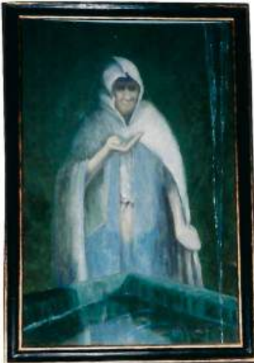
De voorstelling van een Berber vrouw. In de Basiliek Saint Cyprien/Carthago hangt dit schilderwerk. Dit portret doet ons aan Monica denken, als Berbervrouw. (in de reisgids (Elmar) lezen we dat Berber vrouwen zelfstandig en onafhankelijk waren.

en verdieping heeft Augustinus meer betekenis gekregen in mijn leven. Niettemin heeft onze belangstelling voor archeologie en opgravingen meegespeeld om dit te doen. Tunesië ligt in Noord-Afrika en is maar 2.30 uur vliegen. Dichtbij en toch anders. Het is tevens een gastvrij land met een rijke geschiedenis en eeuwenoude tradities. Carthago ligt vlakbij Tunis aan het Middellandse zeegebied. Onze vaste standplaats was een goed Arabisch hotel, in het centrum van Tunis. Bij elke deur stond een bediende, in uniform, om je te beschermen. Elke morgen, dag in dag uit, vertrokken we met de metro vanuit Tunis naar Carthago; Carthago heeft verschillende metro stations.