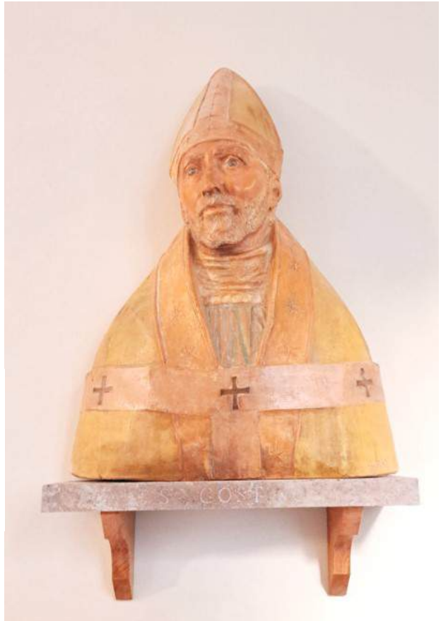
H. Augustinus, borstbeeld in de gang naar de kapel van H. Monnica in Rome