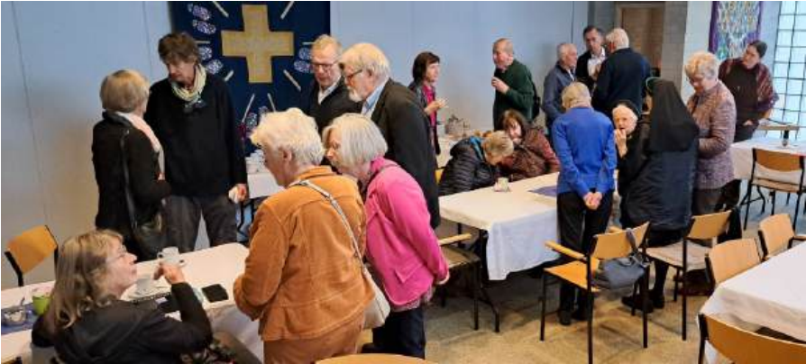
De dag begon na het welkom van iedereen met koffie en gebak