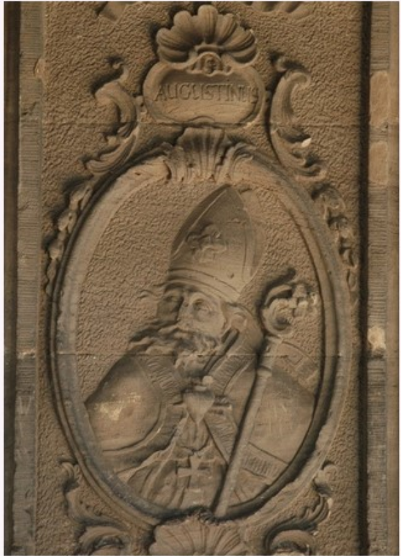
Portret van Augustinus (Porta Nigra, Trier, 18e eeuw)